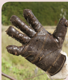
Compost de bonne qualité