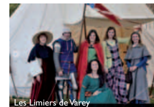
Les Limiers de Varey