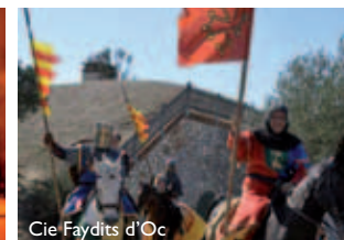
Cie Faydits d'Oc